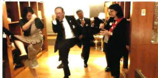
チアガール三本締め決まりました