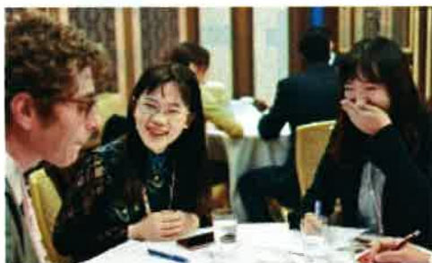
米山奨学生同士楽しく歓談