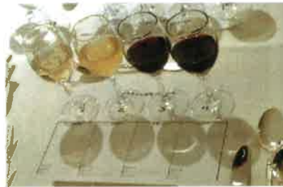
試飲のワイン4種類