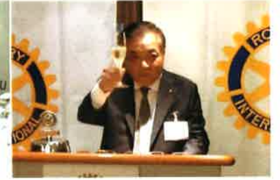
小石川副会長の乾杯