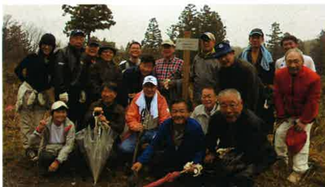
本年度の作業を終了し、記念撮影