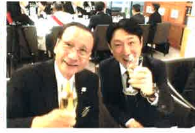
グラスを持って、ハイポーズ