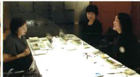
事務局さんいつもありがとう