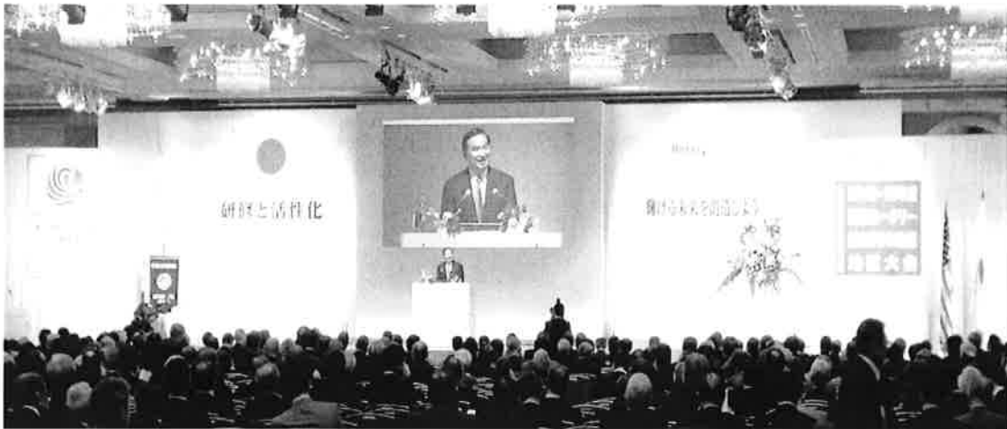
地区大会会場ニューオータニ 鶴の間