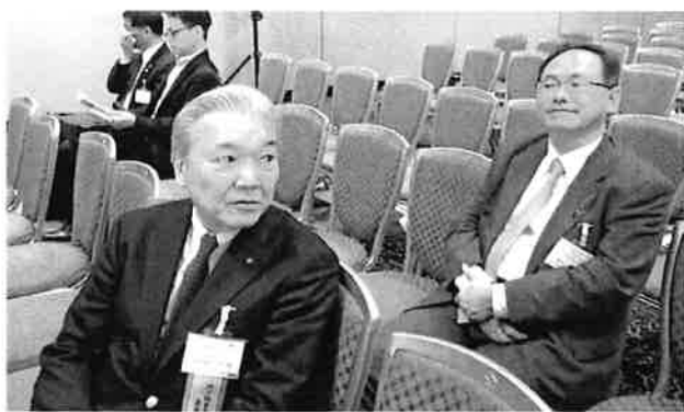
小石川の皆様と同席で講演参加