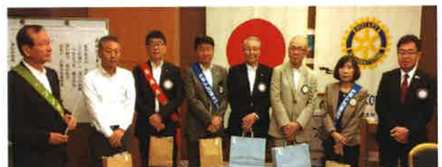
7月お誕生日の皆様

TEL: 03-5940-3355 FAX: 03-3947-4010 E-Mail: koraku@mint.ocn.ne.jp